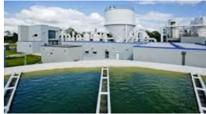
Водоснабжение и канализация